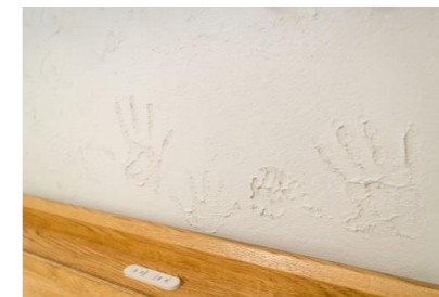
シラス漆喰 ~内装材~