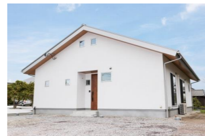
スーパーシラスそとん壁 ~外装材~

新築でも、リフォームでも、カナエホームにお手伝いできることがあります。お家の事なら何でもご相談ください(*^^)v