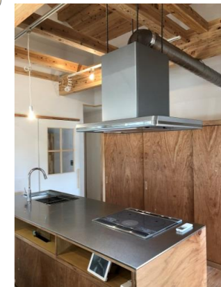
オーダーキッチン

御協力くださいましたお施主様、足を運んで下さった皆様、ありがとうございました <m(__)m>